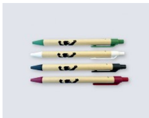
STYLO EN CARTON (Bille bleue à l'unité) 0,20 € TTC