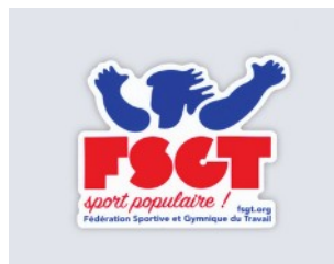
STICKER 0,23 € TTC

Pour toute information ou commande, adressez-vous à accueil@fsgt75.org ou 01.40.35.18.49