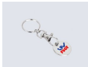
PORTE-CLEFS JETON 1,20 € TTC