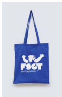
TOTE-BAG bleu 3,50 € TTC