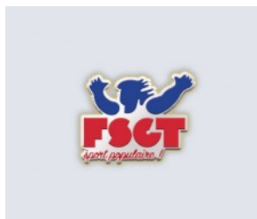
PIN'S aimanté 2 € TTC