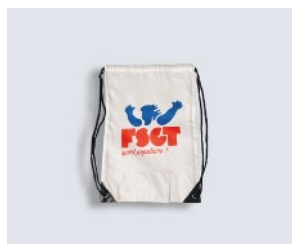
SAC à DOS 3 € TTC